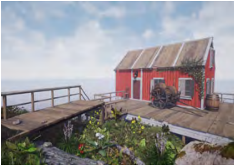
Proyecto de nuestro alumno Dani Sabaté.